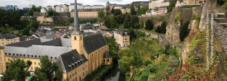
European Institute of Cultural Routes Neumünster Abbey, Luxembourg